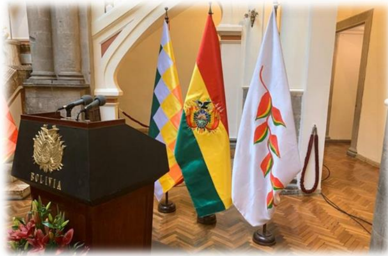
5. kép: a Wiphala, a bolíviai köztársasági trikolor és a patujú zászló egymás mellett.

Mіндеzt gyakorlatilag Áñez expliciten meg is erősíti, méghozzá abban a BBC Mundo interjúban, ahol a riporter többek között arról kérdezi a politikusnőt, hogy tiszteli-e a Wiphalát „mint az őslakos Bolívia szimbólumát” (BBC Mundo 2019). Bár Áñez nem felel konkrét igennel vagy nemmel, válasza bizonyos értelemben mégis meghökkenítően őszinte: „Az [tehát a Wiphala] nyilvánvalóan az országom nyugati felét reprezentálja. A helyzet az, hogy Bolívia rendkívül diverz. Nekünk is megvan a saját zászlónk [azaz a patujú] és ez az első alkalom, hogy az itt van a palotában. Nekem is diszkriminálna kellene éreznem magam, hiszen a tartományom nem rendelkezik reprezentációval az elnöki palotában. De tiszteltem a különböző tartományok kultúráját. A Wiphala pedig egy bevett szimbólum az alkotmányunkban.” (BBC Mundo 2019).