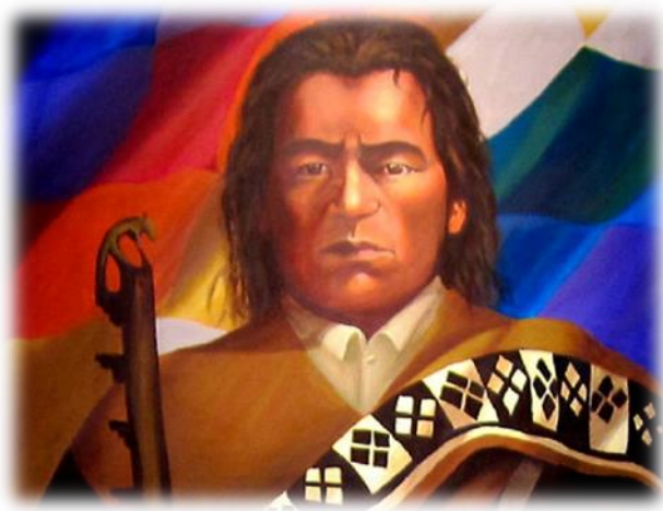
3. kép: az indián vezér, Túpac Katari. (Kép forrása:

Miközben a kokalevél vagy a Wiphala kapcsán azt láttuk, hogy a hangsúly a plurinacionális elképzelések legitimálására, valamint az őslakos múltnak, illetve jelképeknek egy sajátos dekolonizációs narratíva köré szervezésére helyeződik, addig Túpac Katari (lásd 3. kép ) kultuszának elsődleges célja sokkal inkább az, hogy kifejezze azt a fajta történelmi kontinuitást, amely az ország indián nemzeteinek a spanyolok, majd a független bolíviai állam elitjei ellen vívott – egészen napjainkig tartó – küzdelmét jellemzi.