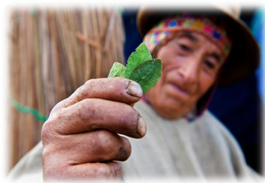
1. kép: a kokalevél.