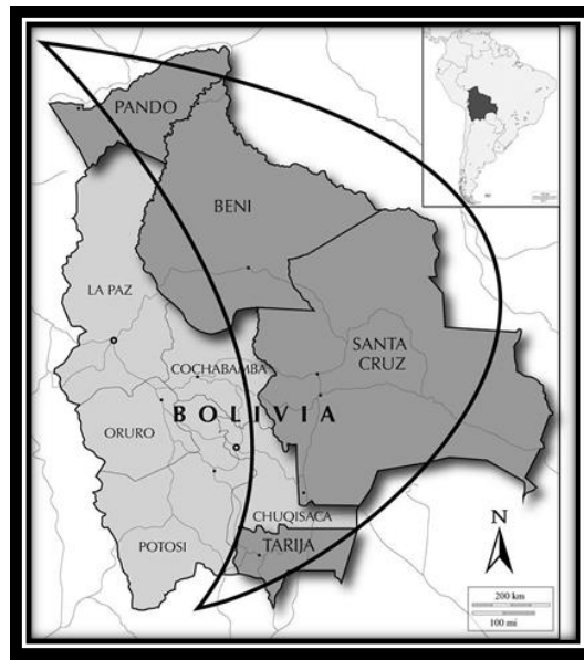
4. kép: Bolívia és a media luna régió. A térkép remekül kiemeli a Pando, Beni, Santa Cruz és Tarija tartományok által formált félhold alakú sávot, amelyről maga a kelet-bolíviai régió is a nevét kapta.